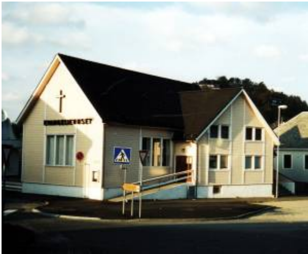
Evangeliehuset, Bøckmans gate 24.

Pinsebevegelsen ble populær blant noen metodister i Egersund i tiden før første verdenskrig brøt ut. De fikk sterk draging mot tilreisende predikanter og tungetalende forsamlinger, og flokken ble smått om senn større. I 1936, da de organiserte seg som dissentermenighet, talte den 40 medlemmer.