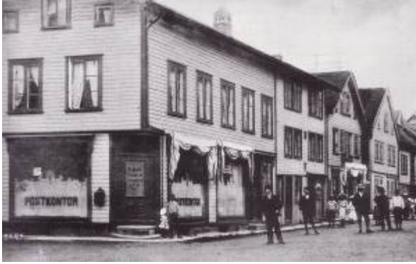
Postkontoret holdt til i Johan Feyers gate 2 i 1905-1910.

I 1890 ble Egersund postekspedisjon oppgradert til postkontor og postekspeditøren fikk tittel av postmester. Noen år senere ble poståpneriene sør for Egersund lagt under Egersund postkontor (de hadde før det ligget under Stavanger), og i 1914 hadde postkontoret 15 underliggende poståpnerier, 8 brevhus og 5 landpostbud og postbefordrere.