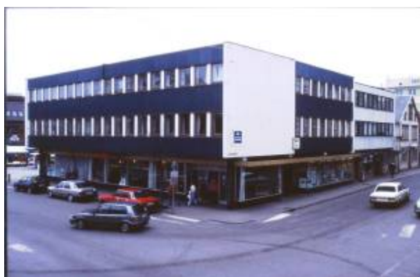
Torggården i 1991.

Plutselig dukket det opp et nytt forslag, utarbeidet på vegne av noen av grunneierne av arkitekt S. Brandsberg-Dahl i Stavanger. Dette forslaget la opp til at bebyggelsen mot Torget skulle gjøres bredere enn de gamle eiendomsgrensene og gateløpene tilsa, og innebar makeskifte mellom kommunen og grunneiere av gateareal til Kirkegaten . Forslaget innebar at kvartalet kunne bli utbygd helt rektangulært, 50×25 meter, uten forstyrrende skjeve vinkler eller usymmetriske linjer.