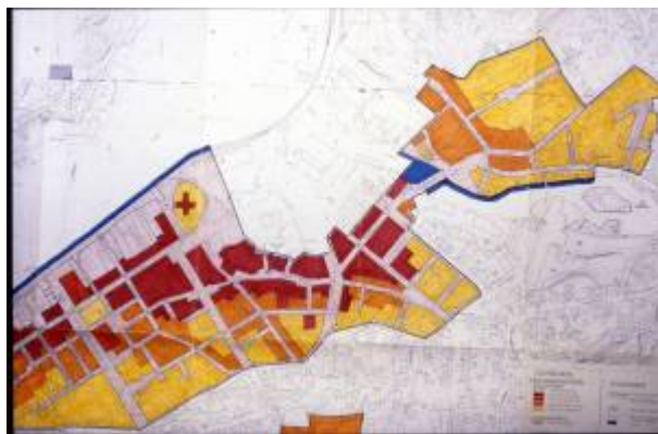
Reguleringsplan 1975. Eigersund kommunes arkiv.

I mars 1974 tok bygningsrådet opp spørsmålet om å få utarbeidet en ny reguleringsplan for Egersund sentrum. Framdeles var det Reguleringsplan 1931 som gjaldt der det ikke hadde blitt foretatt reguleringsendringer opp gjennom årene. Det var også mange konflikter mellom byens myndigheter og den enkelte byggherres ønske om utnyttning av sin eiendom både når det gjaldt riving og nybygging.