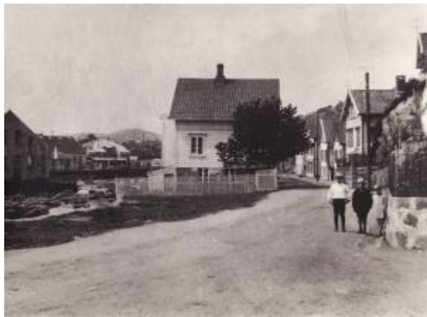
Nyeveien ca 1930, da all trafikk nordfra til og fra byen gikk her.

I 1912 ble det vedtatt en ny veglov som skulle gjelde for landdistriktene, der vegnettet ble inndelt i hovedveger og bygdeveger. I byene var det fortsatt bykommunene som hadde ansvar for alle vegene, enten de hadde gjennomgangstrafikk eller ikke.