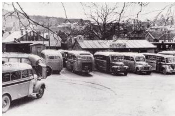
Rutebilstasjonen, 1948.

Karl Heigrestad etablerte i 1937 en gods- og melkerute mellom Hellvik og Egersund. Ruta ble snart utvidet til også å frakte passasjerer – men i første omgang kun fra Heigrestad. Igjen var det myndighetenes skjerming av jernbanen som var utslagsgivende. Ruta hadde holdeplass i Lervika .