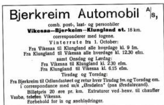
Annonse for ruta Vikeså - Bjerkeim - Klungland. Dalane Tidende 1920

Etter som den biltekniske utviklingen skjøt fart og det overordnede vegnettet begynte å komme på plass lå forholdene godt til rette for en ny form for samferdsel: rutebiltrafikk. Dette førte til økt samhandling mellom by og land. Bøndene kunne sende en stadig større del av sin produksjon til markedet i byen, mens byene på sin side lettere enn før kunne levere varer og tjenester til befolkningen på bygdene. Rutene som ble startet i Dalane illustrer dette. De ble alle etablert i distriktet for å tilby frakt av personer og gods til byen – og til toget. Selskapene var nemlig svært nøye med å opplyse om at "rutene korresponderer med togene". Rutene hadde holdeplasser spredt rundt i byen før det ble etablert en felles rutebilsentral ved Jernbanestasjonen i sentrum kort tid etter frigjøringen.