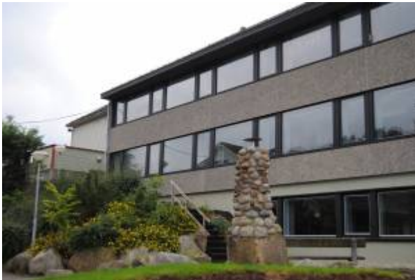
Samfundets skole i Årstaddalen.

I februar 1890 hadde Torkild Valand, som ble den første forstander i menigheten Samfundet , startet en privat barneskole i Egersund. Denne ble overtatt av Samfundet da menigheten var stiftet.