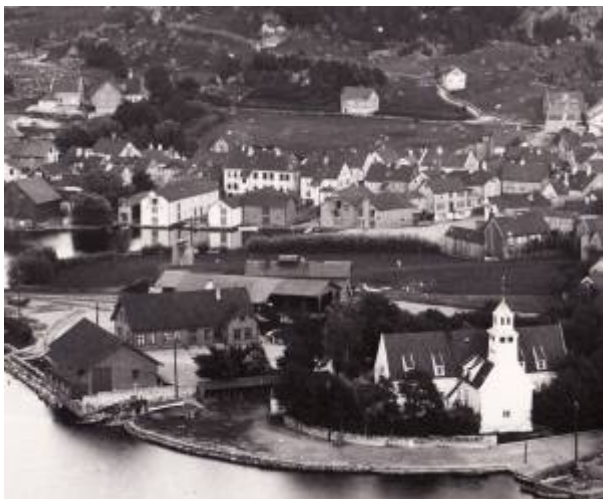
Sandbakken i bakkant, midt i bildet (Utsnitt, 1893).