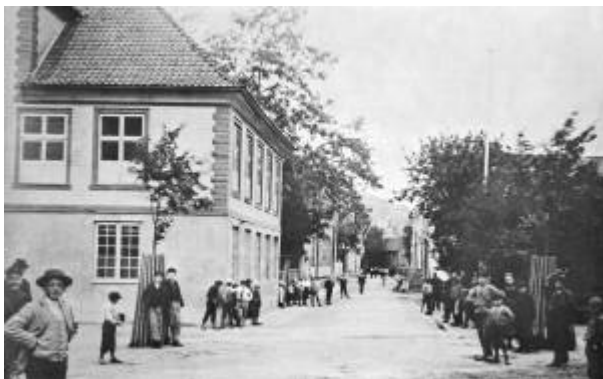
Skrivergården er den mest utpregede bygning i senempirestil.

Empirestilen er en klassisk preget stil- og moteretning som utviklet seg og har navn etter Napoleons keiserdømme. I Frankrike ble stilen brukt i perioden rundt 1800 – 1820 mens den i Norge varte ca. 1810 – 1840. Videreføringen av stilpreget det nærmeste tiåret kalles Senempire . 1)