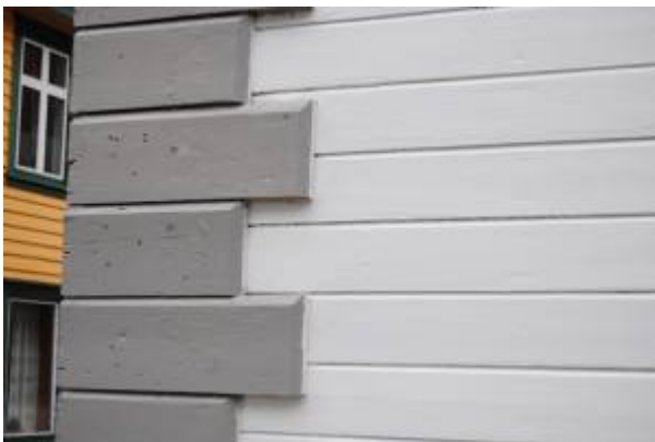
Falske hjørnesteiner, rustika, på Hammergården.