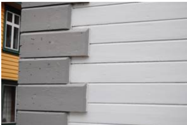
Falske hjørnesteiner, rustika, på Hammergården.