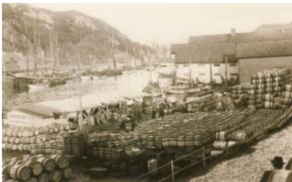
Chr. Michelsens sildelager på Bradbenken 1919.

I Nord-Norge og på Vestlandet hadde det vokst fram en betydelig sildjolje- og sildemelindustri allerede før første verdenskrig, mens det sør for Boknafjorden ikke fantes slike fabrikker. Årsaken til det var at ressursgrunnlaget ikke hadde vært godt nok. I 1918 sa britene opp kjøpeplikten, og for å trygge kystbefolkningens kår kjøpte nå staten opp all fisk som ikke kunne eksporteres. Og det var ikke lite: både i 1916 og 1917 var fangstene enorme. Britenes og statens oppkjøp resulterte i store overskuddslagere av sild, noe som bl.a. medførte at ressursgrunnlaget nå var til stede for å starte fabrikker i Egersund også. I 1918 ble således Egersund Sildoljefabrikk etablert mens Ryttervik Fabrikker startet opp året etter under navnet Egersunds Kraftfor og Sildoljefabrik A/S .