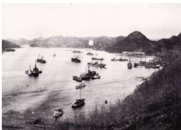
Havna under sildefisket 1918.