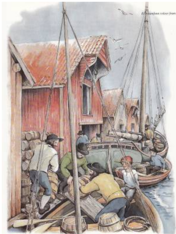
Lasting av fisk og landbruksprodukter fra sjøbuene ved Vågen. Tegning: Reidun Lædre

Fra rundt 1720 og fram til 1742 var sildefisket ut av Egersund godt. Så kom noen år med labert fiske før det kom noen gode år mellom 1746 og 1757. Fra da av trakk silda lenger nord, og egersunderne måtte til Karmøy for å fiske. Slik var det fram til rundt 1770. Men så begynte det å svikte, og i 1783 var det slutt. Da var silda forsvunnet fra områdene som egersunderne kunne nå med sine små båter.