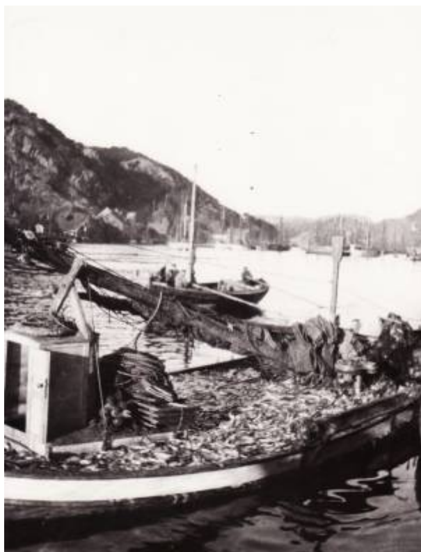
God fangst. Fra sildefisket 1918.

Det var først og fremst som eksportvare at silda hadde verdi. Før første verdenskrig var England det viktigste markedet for fersk sild , tett fulgt av Tyskland. For saltsilda var det stort sett de gamle markedene fra 1800-tallet, Sverige, Tyskland og Russland, som gjaldt. Krigen skapte imidlertid problemer for sildeeksporten etter hvert. Tyskland hadde stort behov for mat både til sivilbefolkningen og de militære styrkene. Under vårsildefisket i 1915 lå mange tyske fartøy langs kysten og kjøpte opp alt de fikk tilgang til, mens britene gjorde sitt beste for å forhindre denne forsyningen til de tyske krigsstyrkene.