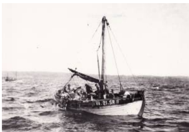
VA21SR «Marie» ut av Egersund under sildefisket 1920.

Det ble en sunnmøring som først tok initiativ til å utnytte det nye sildeinnsiget. Salmon Dyb hadde erfaring fra storsildfiskeriene nord på Vestlandskysten, og så nå muligheten for å etablere seg i Egersund.