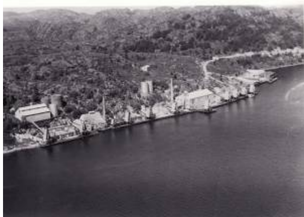
Egerø Sildoljefabrikk (lengst fra kamera) og Leidland Sildoljefabrikk ble satt i drift i hhv. 1938 og 1939.

Det gode ressurstilgangen ga grunnlag for utvidelse av fabrikkapasiteten, og i 1938 etablerte Isak O. Seglem Egerø Sildoljefabrikk ved Nysund. Året etter sto Leidland Sildoljefabrikk klar like ved. Stadig modernisering og utvikling av de to eldste fabrikkene og etablering av to nye fortonte seg som et industrieventyr for byens befolkning, dog ispedd en smule bitterhet over at alle virksomhetene lå i landsoknet mens byen måtte slite med lukta.