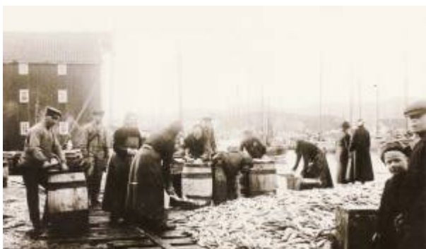
Silde salting på Skriverallmenningen 1918.

I 1919 var første verdenskrig over og den frie handel skulle gjenopprettes. I det krigsherjede Europa var det stort behov for mat, og folk i sildenæringen håpet på at alt skulle bli slik det hadde vært før krigen, med godt fiske og god avsetning for både fersk og salt sild. Sildefisket fortsatte for fullt, og 1919 ble et nytt toppår, enda bedre enn 1916. Men indre uro og valutaproblemer både i Sovjetunionen og Polen, de beste markedene før krigen, gjorde det nesten umulig å få solgt saltsild der. Da den tyske marken kollapset var det heller ikke mulig å selge sild til Tyskland med rimelig fortjeneste. Resultatet var at det om sommeren 1921 lå lagret sild for mellom fem og seks millioner kroner i området mellom Flekkefjord og Egersund, mens sildespekulantene satt nedtyngt i gjeld. Økonomisk sett nærmet det seg kollaps.