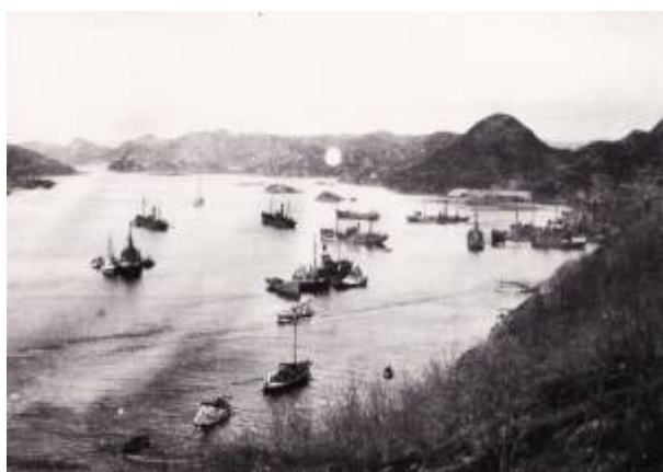
Havna under sildefisket 1918.