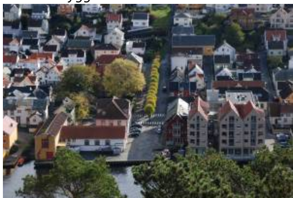
Også i 2012 er utsikten best fra Kontrari.