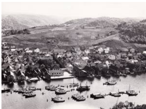
Skriversbrygga midt i bildet. Ca. 1920.