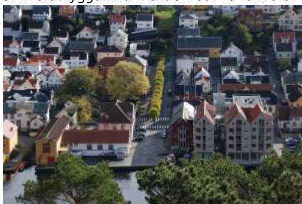
Også i 2012 er utsikten best fra Kontrari.