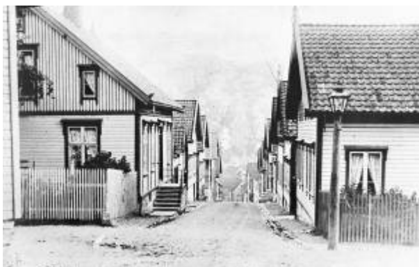
Langs Kirkegaten og i områdene rundt er det mange hus i sveitserstil.

Sveitserstilen kom til Norge rundt 1840, i en tid da nasjonsbygging sto sterkt. Betegnelsen er noe misvisende, da stilen i realiteten består av tradisjonelle former for trehusarkitektur hentet fra flere steder i Europa. I Norge var tysk arkitektur en særlig viktig inspirasjonskilde. Fordi den brøt med det klassiske formspråket som var basert på forbilder i murverk som hadde dominert norsk trearkitektur, ble sveitserstilen oppfattet som et utgangspunkt for utvikling av en «Nasjonal trestil».