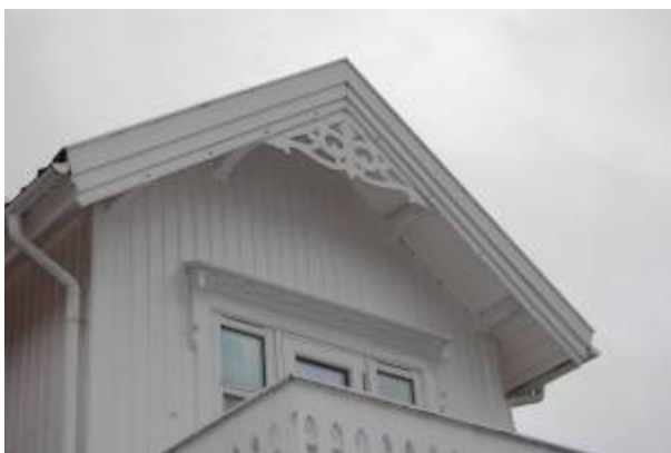
Detalj fra hus i sveitserstil.

Sveitserstilen kom til Norge rundt 1840, i en tid da nasjonsbygging sto sterkt. Betegnelsen er noe misvisende, da stilen i realiteten består av tradisjonelle former for trehusarkitektur hentet fra flere steder i Europa. I Norge var tysk arkitektur en særlig viktig inspirasjonskilde. Fordi den brøt med det klassiske formspråket som var basert på forbilder i murverk som hadde dominert norsk trearkitektur, ble sveitserstilen oppfattet som et utgangspunkt for utvikling av en «Nasjonal trestil».