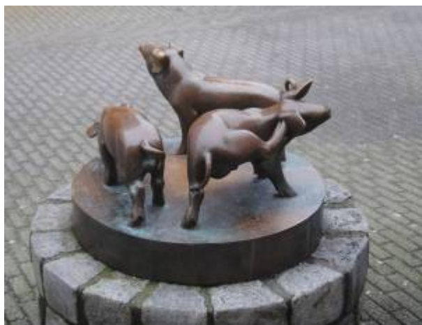
Tre små griser på Grisatorget.

Skulptur i bronse som står plassert på Grisatorget . Den er utført av Skule Waksvik. 1)