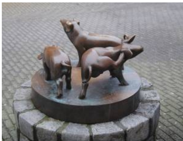
Tre små griser på Grisatorget.