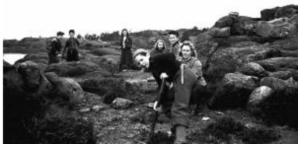
Skolebarn på skogplanting ved Kjerketjødne/Nordsjøen i 1944.

Byens unike friluftsområde, beliggende øst for sentrum, bærer med sine småvann, stier, lysløype og vegetasjon sitt navn med rette. Området ville ikke hatt sin nåværende form om ikke de første magasiner til Egersund vannverk hadde blitt anlagt her.