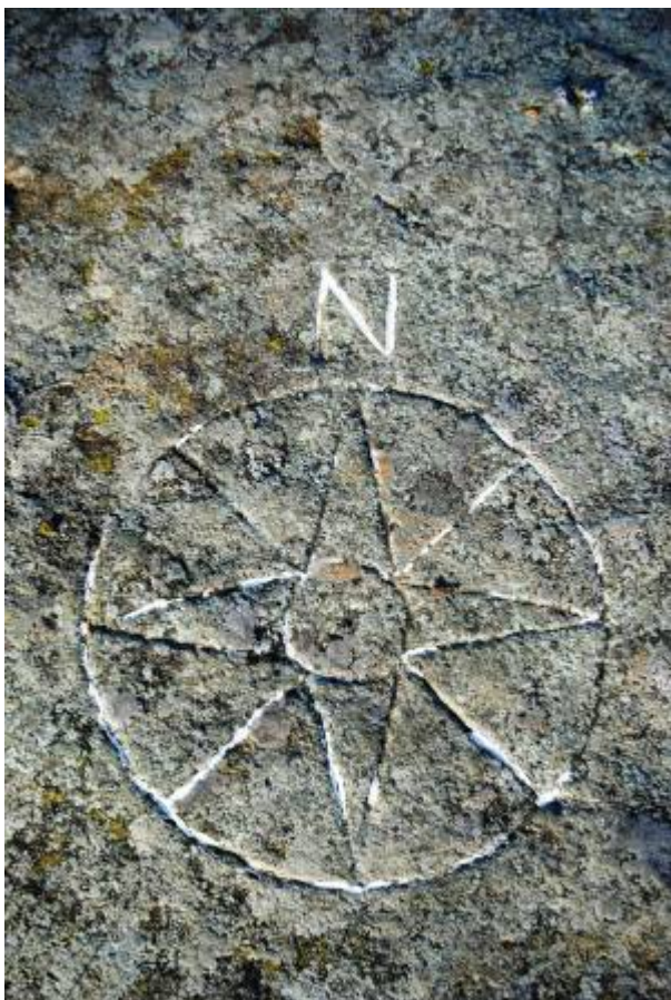
Den yngste kompassrosa på Vardberg.

Ved foten av fjellet, i enden av Øvre Prestegårdsvei, finnes det et lite helleristningsfelt fra yngre bronsealder (ca. 1000 - 500 f.kr.), der motivet er to skipsfigurer.