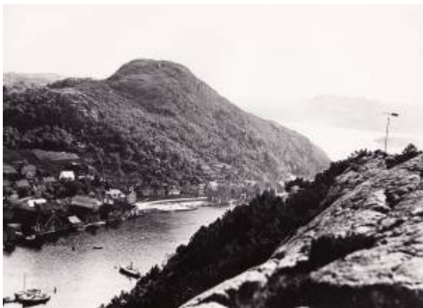
Vardberg ca 1920.

(Varberg, Vardberg (off.)) Vardberg kan bety fjellet der varden sto eller stedet som en varslet krig og ufred fra ved hjelp av veter 1) . Beliggenheten ved Husabø peker mot den siste betydningen. Plikten til å holde veter går tilbake til Håkon den gode (konge 934-961), og Vardberg, som kun rager 125 m.o.h. men har en formidabel utsikt, var et naturlig punkt å ha vete på 2) .